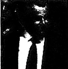
أسحق مورديخي وزير الخارجية الإسرائيلي